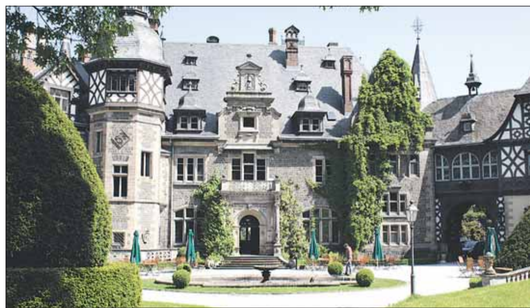
Das kleine »Neuschwanstein« im Landkreis Marburg-Biedenkopf: das Schloss in Rauschholzhausen.

Dazu zählten unter anderem ein Kindergarten, die Grundschule,