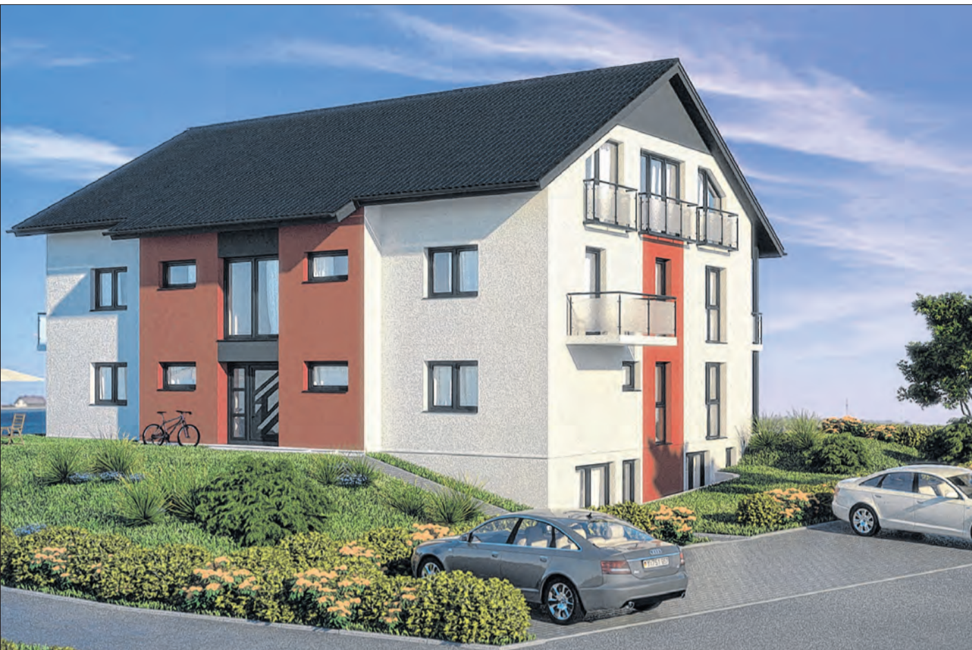
So soll das Massivhaus mit neun Eigentumswohnungen nach der Fertigstellung aussehen.

Baubeginn ist im Frühjahr 2015 – Viele Einrichtungen und Einkaufsmöglichkeiten fußläufig erreichbar